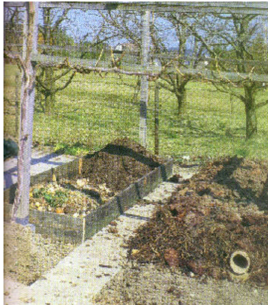
Instalación de pila de compost con tubo de aireación en el medio, a lo largo del compost.

▪ El montón se calienta pero desprende un fuerte olor a amoníaco. El olor a amoníaco indica que se ha añadido demasiado nitrógeno. No es necesario corregirlo pero nos indica que debemos incorporar menos cantidad de material nitrogenado la próxima vez, si es que se utilizan materiales similares.