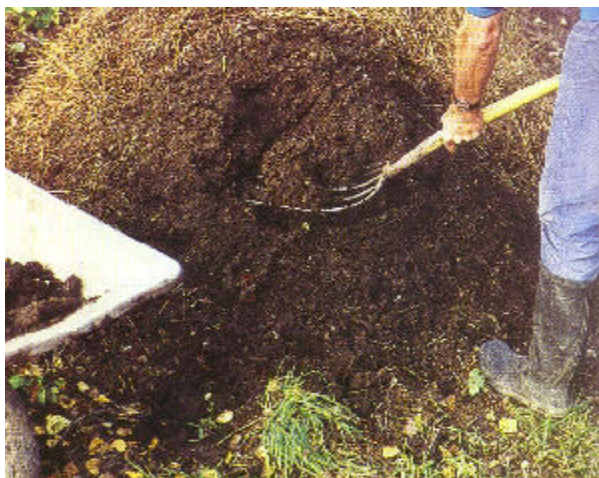
Se puede obtener en 6 meses durante la época primaveral un buen compost.

Después de colocar cada capa de material orgánico hay que regar ligeramente para que el montón tenga una humedad homogénea ( como una esponja mojada exprimida ). La falta de humedad reduce la actividad microbiana, mientras que el exceso