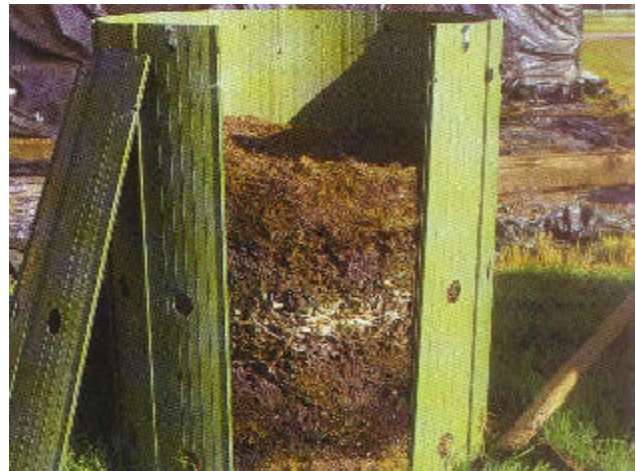
Dos modelos para la obtención de una buena descomposición del compost.

compost en cajoneras cuando se dispone de poco material.